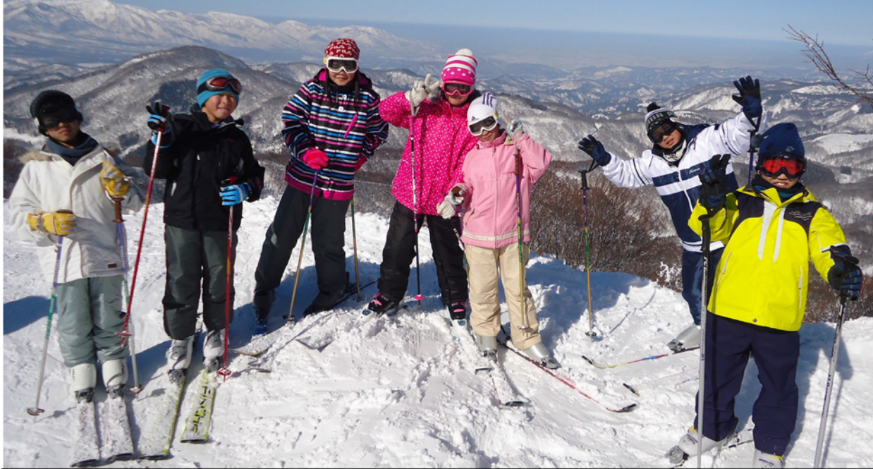
斑尾高原スキー場(飯山市)より 遠く日本海を望むこともできる