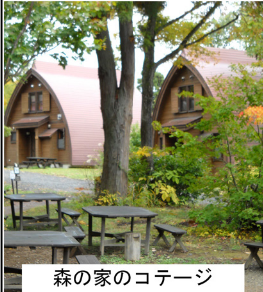
森の家のコテージ

3棟、たたみ部屋3棟、洋室4棟である。コテージ内には自然可能なキッチンがあり、自宅と同じようにゆったりと自分達の間を過ごす事ができる。和室