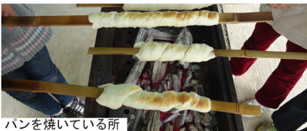
パンを焼いている所

「炭火パン作り」を体験した。2人1組になり、1人が火をたき、もう1人が生地をこねる。次に材料を袋に入れて混ぜる。混ぜ終わったら、生地を細長くして、棒のはじより5センチ位の所から斜めにまく。生地がまけたら、あみが無いコンロで焼く。