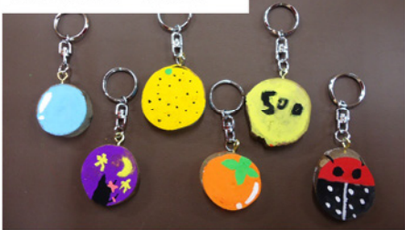
完成したキーホルダー

り、その後細かい所などを塗る。そして少し待つと完成する。数分で乾くので、予想より早く完成した。世界に1つだけしかない自分だけのキーホルダーだ。