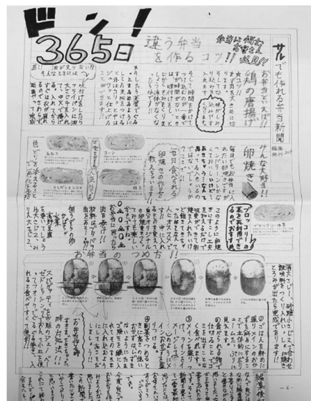
図 1 フードデザインで作成した新聞

さらに、学習のなかで分かったことを他者にわかりやすく伝えるため、新聞の紙面のようなかたちで学習成果をまとめた。新聞の見出しのつけ方を参考に、見てもらえるよう、生徒それぞれで工夫をして作成することで、自分の考えたことを表現することができる学びになったと考えている。