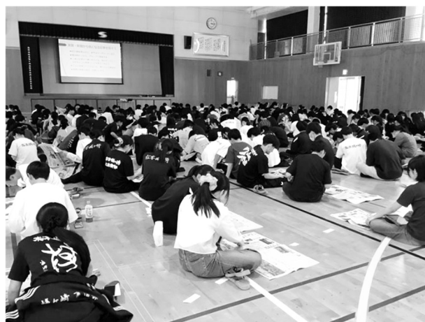
図 2 総合的な探究の時間の新聞学習

学習活動そのものが有意義なもので、それに加え、280名弱の生徒が一堂に会して新聞を熟読する様子そのものが圧巻だったと、NIEに関わる者として感じている。